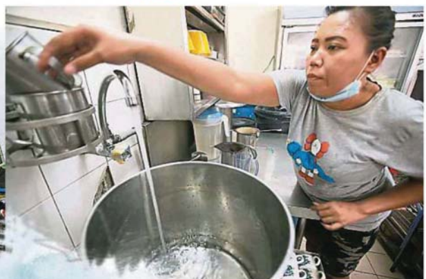
食肆业者已开始储水, 以应付下周二开始的制水期。