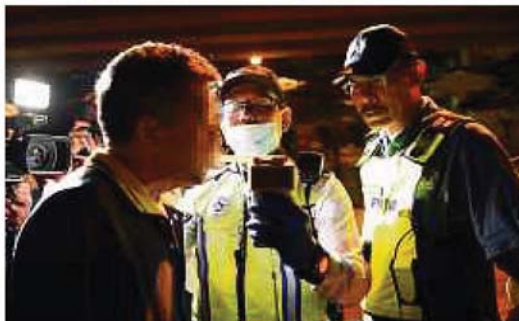
ANGGOTA polis membuat pemeriksaan terhadap pemandu kenderaan ketika Operasi Mabuk di sekitar Ampang, awal pagi semalam.