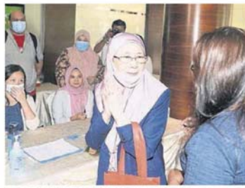
■旺阿兹莎在柜台登记及使用搓手液。

赛夫丁纳苏迪安受询时说，希望已邀请马哈迪出席汇报会，至于他为何没出席，媒体则需亲自问他。 希望国会议员是从下午1时30分起陆续