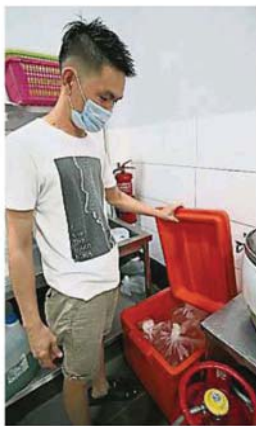
部分食肆业者使用塑料袋储水, 即能节省空间又能储存更多备水。

難以大量儲水或暫停營業 部分受访商家表示, 由于餐饮业需要用到大量自来水, 加上制水数日, 预计将对他们造成很大影响; 因此, 他们已做好打算, 选择储存水或暂时休息数日, 直到恢复供水为止。 “我们经营食肆的, 需要使用大量自来水管清洗食材及店面, 一旦面对制水问题, 我们将受到影响, 即使有备水, 但也难以应付日常的营业。” 他们说, 由于店铺地方有限, 加上制水数日, 他们实在难以大量储水, 加上制水期间营业的不便, 因此只好忍痛做出决定, 在制水期间暂时休息不营业。