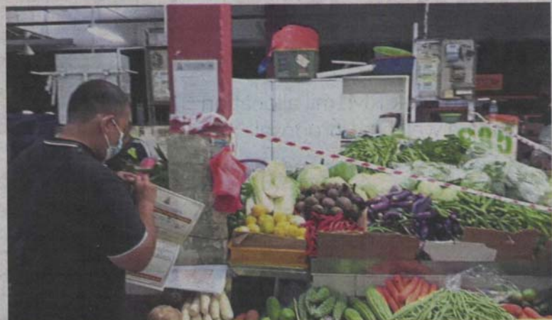
Two vegetable stalls and one selling chicken being sealed for allowing foreigners to man them during the early morning operation at Pasar Besar Jalan Othman in Petaling Jaya.

The market, built in the 1980s, has over 500 lots.