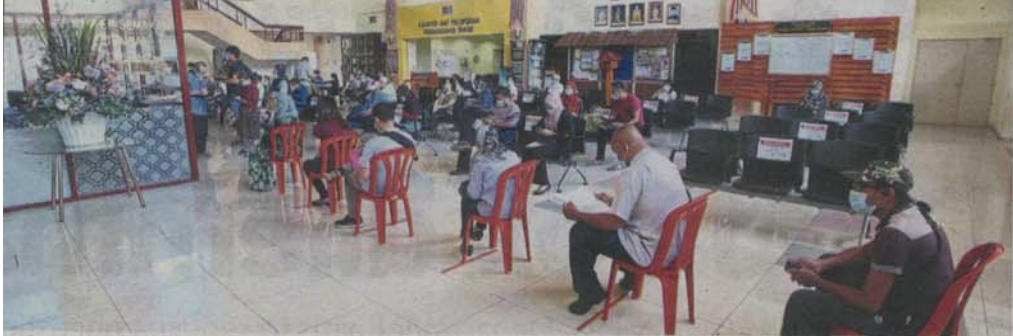
Visitors at the Klang District and Land Office waiting to get a number for their transactions.

Provided for client's internal research purposes only. May not be further copied, distributed, sold or published in any form without the prior consent of the copyright owner.