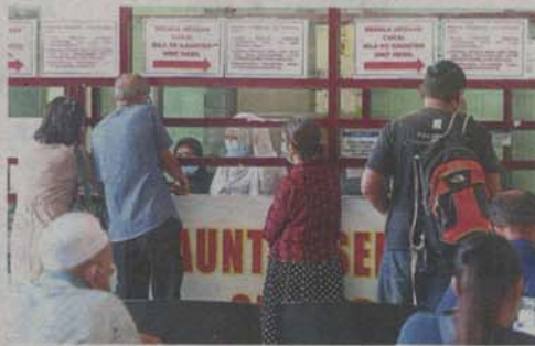
There is no drop box or separate days for different transactions in Klang.

"We had to wait really long but I could always complete what I want