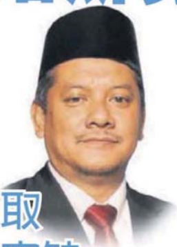
■新任副議長。 哈斯努料將出任為雪州