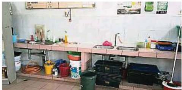
咖啡店的廚房空間有限，現在又因制水，業者需預留洗杯的水，十分麻煩。