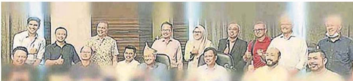
党领袖召开会议。 4) 与其派系、民兴 马哈迪 (坐者左)

(吉隆坡12日讯) 国会下议院明日复会，国内3大政治阵营分别召开了共4场会议，为明日的国会做好事前准备。