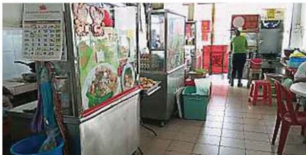
小販攤位空間原本就不寬敞，現在還要置放水桶，非常不便。