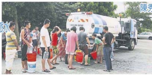
斷水給各造帶來嚴重困擾，商民皆希望水槽車能全天候按時提供充足水源。(檔案照)

“我們希望水槽車能全天候按時提供充足水源給所需的居民，避免發生居民需要長時間苦候取水的情況。”